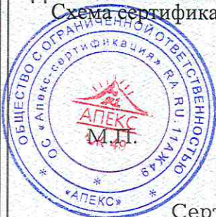
Схема сертификации: 1с.